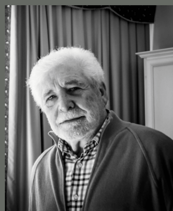
Leggerà alcune liriche di "La danza della pioggia" il maestro Ugo Pagliai