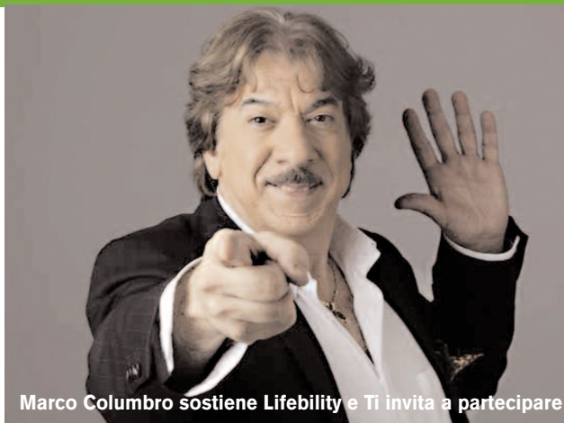
Marco Columbro sostiene Lifeability e Ti invita a partecipare