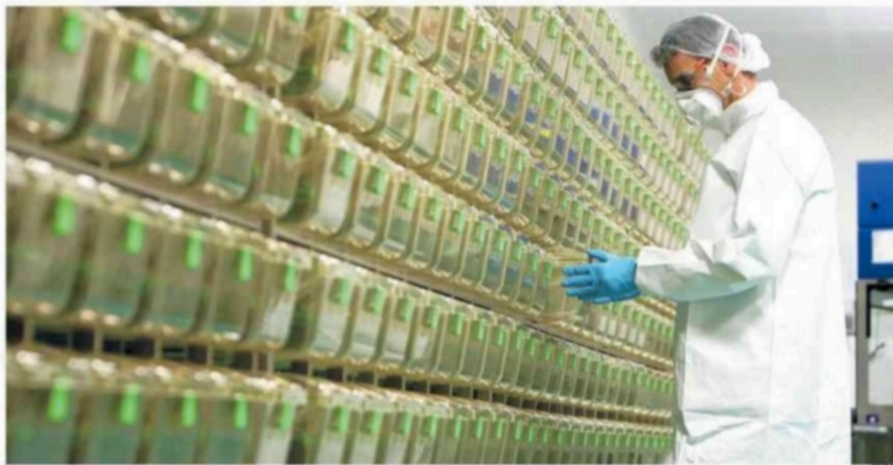
Ricercatori al lavoro nei laboratori dell'azienda farmaceutica Irbm Science Park di Pomezia (Roma)