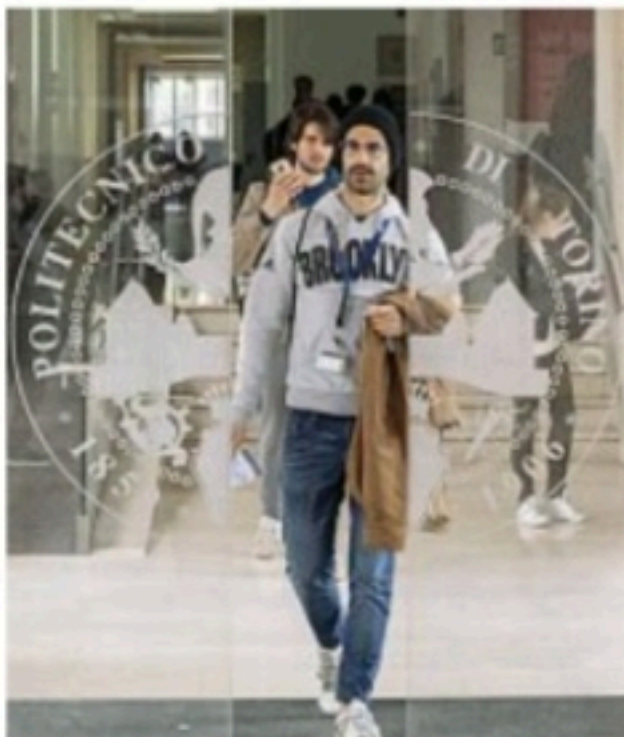
Aule Uno straniero su 10 sceglie Torino per studiare

«Meno studenti presenti fisicamente significa meno affari per bar, librerie e ristoranti che gravitano attorno all'ateneo. L'effetto moltiplicatore dell'università è molto alto a livello economico. Ma cerchiamo di pensare in positivo: la digitalizzazione ci offre opportunità straordinarie. Io sono convinto che tante persone, anche in età avanzata, potendo seguire la sera le registrazioni de corsi, torneranno ad iscriversi e a studiare».