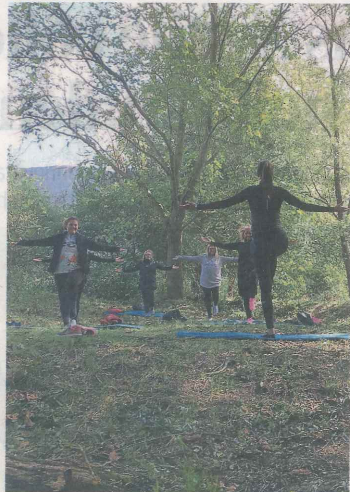
Una fase dell'allenamento delle donne in ambiente naturale