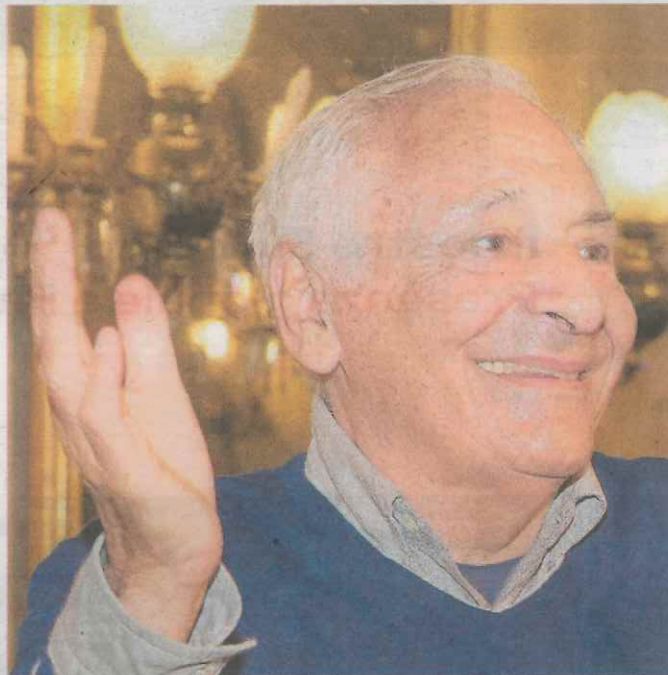
Il grande paroliere della musica italiana Giulio Rapetti , in arte Mogol