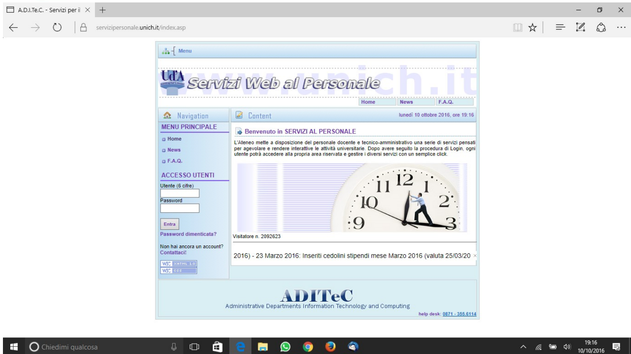
Figura 2- pagina web del servizio al personale (fino al 2014)

Quindi, ad esempio, se cambieremo la password alle 12.35, essa sarà valida sui sistemi che la utilizzano dalle ore 13.00.