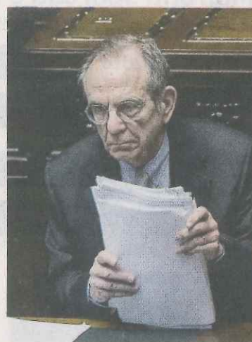
Il ministro Padellaro

EVASIONE FISCALE, L'OBBLIGO DI FATTURAZIONE ELETTRONICA TRA PRIVATI POTREBBE SLITTARE