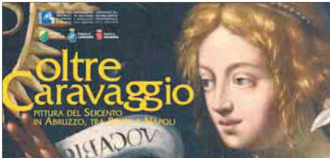
"Oltre Caravaggio", locandina della mostra