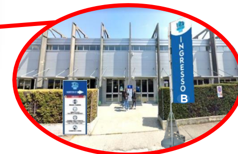
INGRESSO “B” VIA POLACCHI, 19 (AULE SEDE PSICOLOGIA)