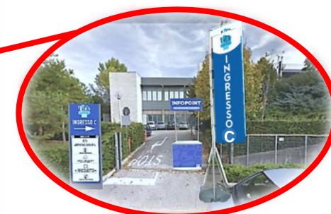
INGRESSO “C” VIA POLACCHI, 15 (AULE SEDE I.T.A.B.)