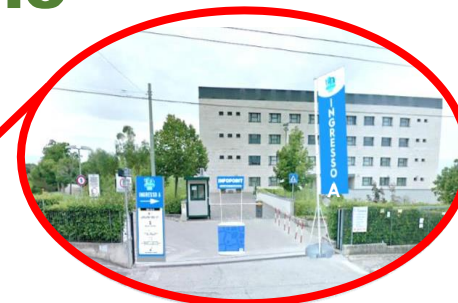
INGRESSO “A” VIA DEI VESTINI, 31 (AULE SEDE MEDICINA - FARMACIA)